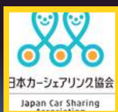
日本カーシェアリング 協会