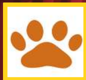
捨て猫をなくす会