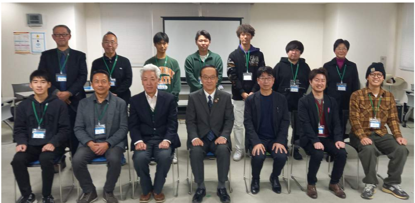
全6回の講座 おつかれさまでした