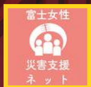
富士女性災害支援 ネット