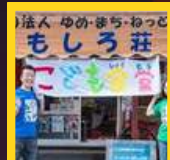
ゆめ・まち・ねっと