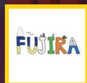
コロマガプロジェクト 富士

当センターでは、新聞記事などプレスに取り上げられた活動を「PressClip」として館内に掲示し、そのアーカイブをファイル保存しています。今回、本年度話題になった活動をピックアップし、「コミュエフが勝手に選ぶ市民活動アワード」を開催。ノミネートで選ばれた活動は、法人部門、市民活動部門、企業部門合わせて9の事業です。皆さまの関心度で選ぶ「推し活投票」はネットと館内にて、2月末まで受け付けていますので、ぜひご参加ください！