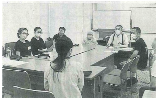
インクルーシブ教育の普及に向けて課題を話し合う参加者 ＝富士市の市交流プラザ