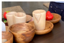
森の陽だまりプロジェクト 森のひろば

専門職情報交換会・産前産後サポート事業 「ママのおうち」・子育て支援ネットワーク 構築・木を感じる「森の陽だまりプロジェクト」 森のひろば・妊娠期や子育て期の各種講座 開催・講師派遣