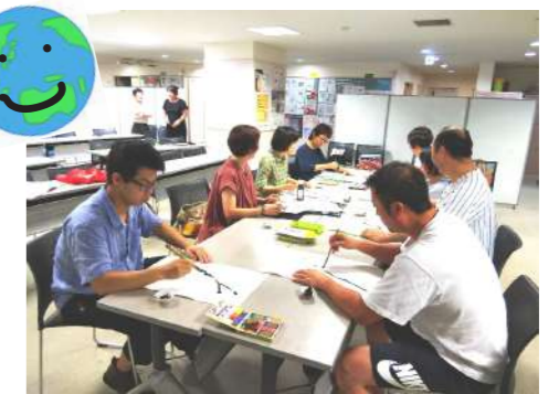
▲昨年度行われた「はじめよう！国際交流ボランティア」講座 2019の様子